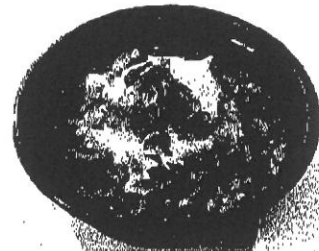
温玉キムチ納豆丼 500円