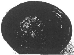
カレー丼 400円 トッピングあり