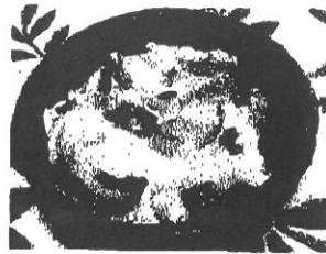
天津丼 400円 具材は変更します